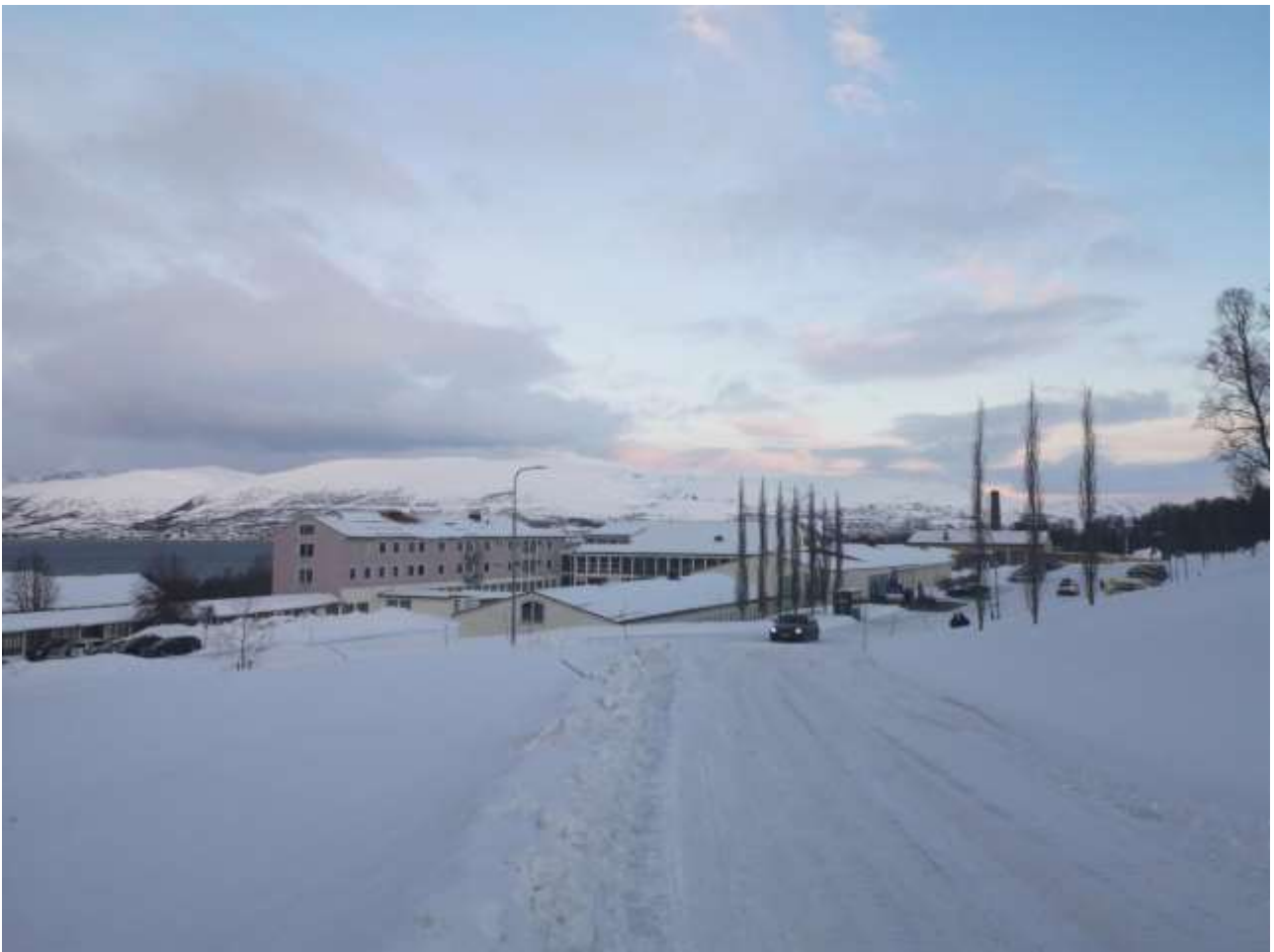
Tromsø Asgardo psichiatrijos ligoninė (Norvegija).

Patekus į skyrių, įvertinamas protinis pajėgumas. Skyriuje be vaistų gali gydytis tie, kurie prieš patekdami į skyrių įvertinami kaip galintys suprasti savo veiksmus ir priimti sprendimus.