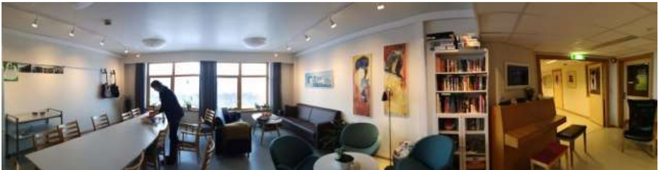
Tromsø Asgardo psichiatrijos ligoninės skyrius be vaistų (Norvegija).